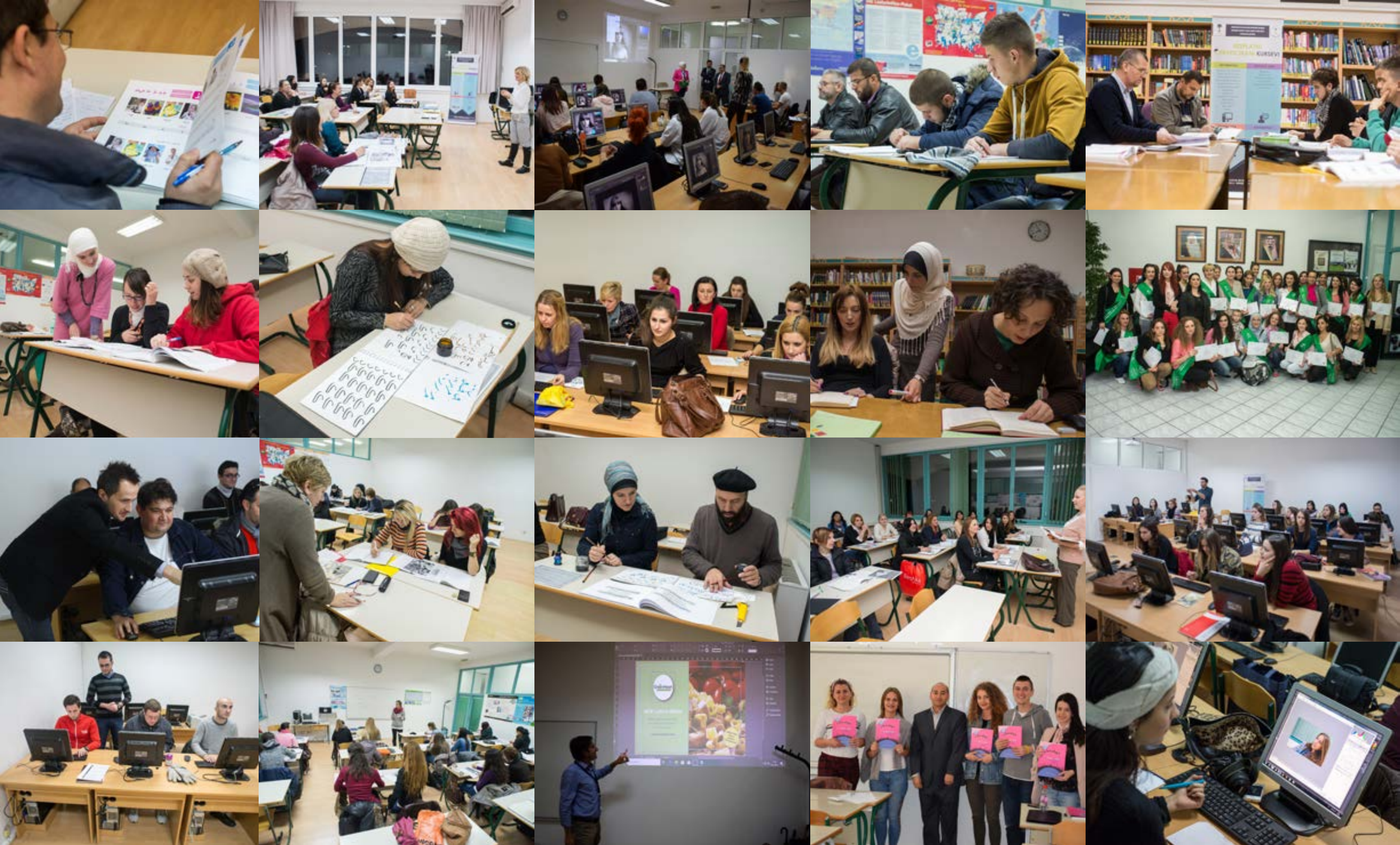
20 godina zajedno ostvarujemo ciljeve i ustrajavamo u izazovima....